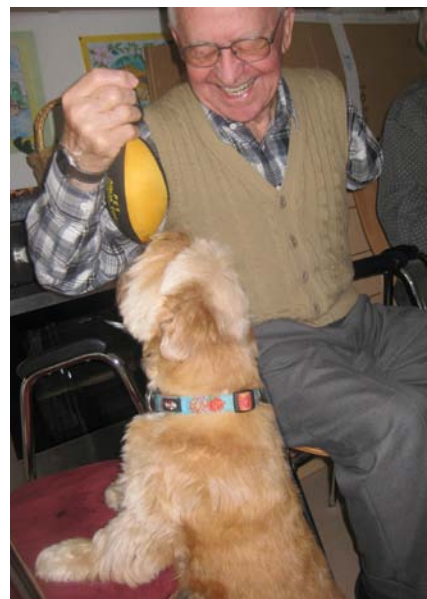
Ob Spielen oder Streicheln: Besuchshunde im Seniorenheim erinnern viele Bewohner an damals und haben besonders auf ältere Menschen eine beeindruckende Wirkung.

Wissenschaftlich konnte nachgewiesen werden, dass der Kontakt zu Tieren bei älteren Menschen unter anderem positive Auswirkungen auf den Blutdruck, die Atemfrequenz und die Muskelspannung hat, was natürlich für alte Menschen ohne diese Erkrankung ebenfalls gilt. Die emotionale Wirkung lässt sich nicht in Zahlen ausdrücken, ist jedoch immer wieder besonders beeindruckend mitzuerleben. Mehr und mehr Senioreneinrichtungen erkennen dies und gestatten Tiere als Besucher oder sogar als ständige Mitbewohner. Leider gibt es jedoch nach wie vor Heime, die aus hygienischen Gründen Tierbesuche ablehnen und dadurch ihren Bewoh-