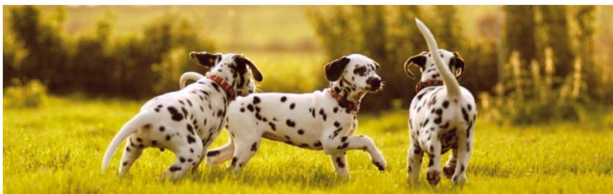
Für die Stärkung des Immunsystems ist ausreichende Bewegung, aber auch der richtige Impfschutz sehr wichtig, damit der Welpen gesund und kräftig bleibt.

Schon im Mutterleib werden die allermeisten Welpen mit Spulwürmern infiziert. Deshalb entwirmt ein verantwortungsvoller Züchter die Kleinen ab der zweiten Lebenswoche im 14-tägigen Abstand. Im neuen Zuhause sollte der Hund dann bis zum sechsten Lebensmonat alle acht Wochen, später alle drei Monate eine Wurmkur bekommen. Ein verwurmter Hund kann nicht nur schwer erkranken, in seiner Entwicklung gestört werden oder bei massivem Befall sogar sterben, sondern stellt unter Umständen auch eine Ansteckungsgefahr insbesondere für Kinder und abwehrgeschwächte Menschen dar. Moderne Entwurmungsmittel sind gut verträglich und können bedenkenlos in den empfohlenen Intervallen verabreicht werden. boss