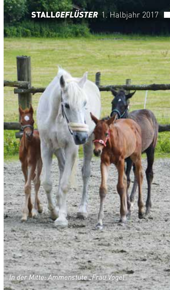
In der Mitte: Ammenstute „Frau Vogel“

Frau Vogel ist Deutschlands bekannteste Ammenstute und ermöglichte schon so manchem aufgegebenen verwaisten Fohlen einen artgerechten Start ins Leben.