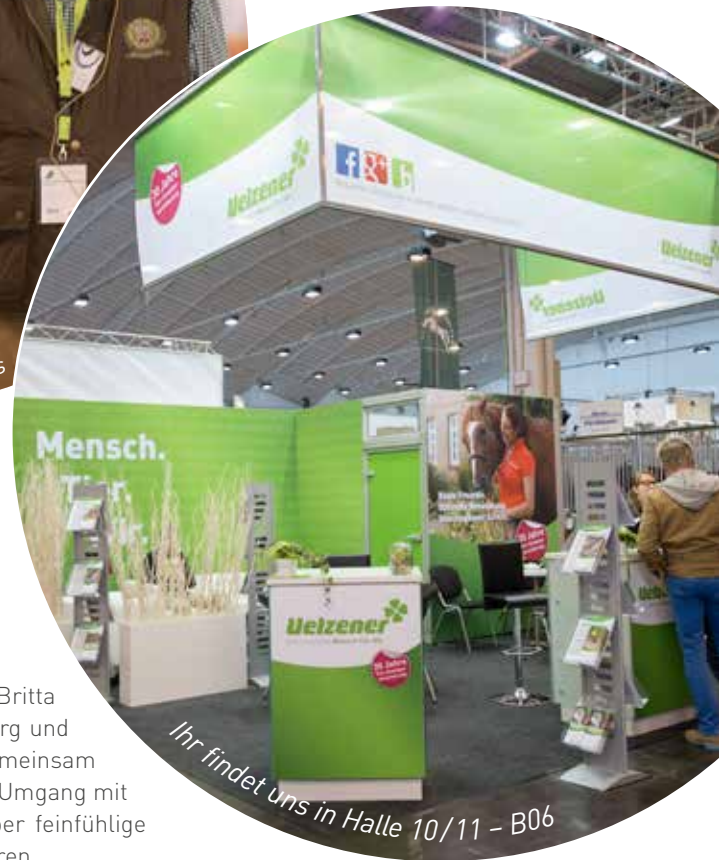
Ihr findet uns in Halle 10/11 - B06

Wer auf der Weltmesse des Pferdesports auch abends noch etwas erleben möchte, der kann am Sonntag, den 19. März, die Zuchtgala der Hengste besuchen. Die Top-Vererber verschiedenster Gestüte, Zuchtverbände und Stationen treffen sich hier zu einem einzigartigen Stelldichein. Am Donnerstag, dem 23. März, gehört der Abend den Pat-Parelli-Fans. Der weltbekannte Horsemanship-Trainer präsen-